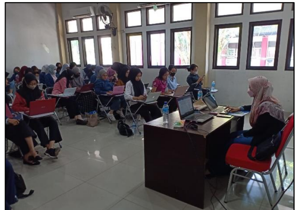
Gambar 4 Suasana Pelaksanaan Pelatihan

Evaluasi kegiatan pengabdian kepada masyarakat ini telah dilaksanakan dengan cara pengisian angket evaluasi. Berikut hasil analisis kuesioner yang telah dikumpulkan dari peserta, dapat diketahui apabila: