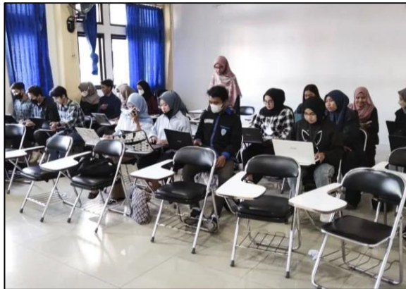
Gambar 1 Suasana Pelaksanaan Pelatihan

membutuhkan usaha dan waktu yang lebih besar. Sehingga dengan dilaksanakannya Pelatihan Penggunaan Mendeley, diharapkan dapat memudahkan mahasiswa dalam melakukan sitasi dalam publikasi ilmiah. Berikut foto-foto kegiatan pengabdian yang dilakukan: