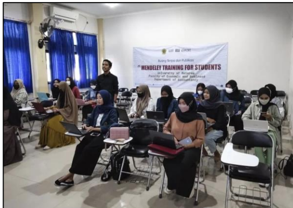
Gambar 3 Suasana Pelaksanaan Pelatihan