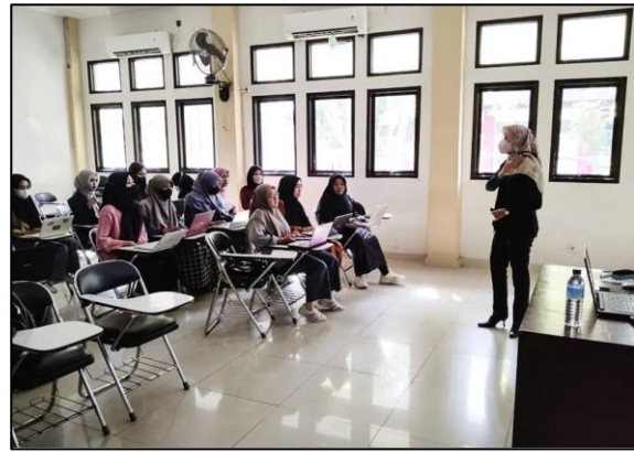
Gambar 2 Suasana Pelaksanaan Pelatihan