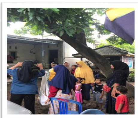
Gambar 6. Suasana Kegiatan Posyandu Balita