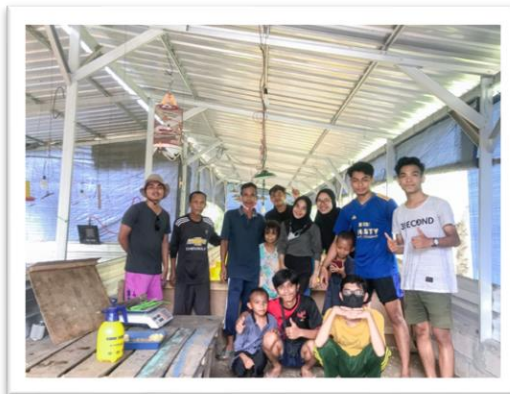
Gambar 4. Foto Bersama Setelah Kegiatan

Sanitasi kandang ayam merupakan suatu kegiatan biosekuritas sebagai usaha pencegahan terhadap penyakit dengan cara menghilangkan atau mengatur faktor-faktor lingkungan yang berkaitan dalam rantai perpindahan penyakit tersebut. Tindakan ini bertujuan untuk memutus rantai penyakit dan mencegah terjadinya wabah untuk kelompok ayam selanjutnya. Sanitasi kandang ayam dapat dilakukan dengan 2 (dua) cara yaitu pembersihan dan desinfeksi secara menyeluruh (hal ini dilakukan untuk seluruh area kandang) dan pembersihan dan desinfeksi kandang parsial (dilakukan terhadap lantai kandang dan sekitarnya). Kegiatan sanitasi kandang ini dilakukan di kandang BUMDes yang berada di Kampung Sasak, Desa Seruni Mumbul yang dilaksanakan pada hari Selasa, 17 Januari 2023. Dalam kegiatan sanitasi kandang ini kami selaku mahasiswa KKN membantu karyawan kandang dalam proses pembersihan kandang mulai dari pergantian litter, penyemprotan kandang, sampai pelebaran kandang.