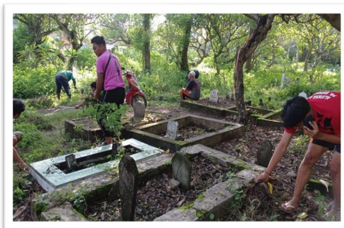
Gambar 11. Kegiatan Pembersihan TPU bersama Perangkat Desa

Kerja bakti pembersihan TPU merupakan kegiatan selanjutnya, yang merupakan kegiatan kerja bakti rutin yang dilaksanakan setiap minggu, yang melibatkan seluruh perangkat Desa dan masyarakat Desa Seruni Mumbul. Sasaran kerja bakti kali ini adalah pembersihan semak, rumput dan sampah di areal makam. Kegiatan ini dilaksanakan pada Jum'at 13 Januari 2023. Di mana mahasiswa KKN Tematik Universitas Mataram bekerja sama dengan perangkat desa dan masyarakat langsung. Program tersebut juga dihadiri langsung oleh Bapak Sekretaris Desa dan Semua Kepala Dusun desa Seruni Mumbul. Kebersamaan dengan seluruh komponen masyarakat untuk peduli akan kebersihan lingkungan harus tetap dijaga bersama, di samping itu kegiatan tersebut merupakan hal positif yang bertujuan membangun masyarakat dalam menumbuhkan semangat gotong royong. Kegiatan ini diharapkan tetap berlangsung agar dapat menciptakan kebersamaan antara perangkat desa dan masyarakat.