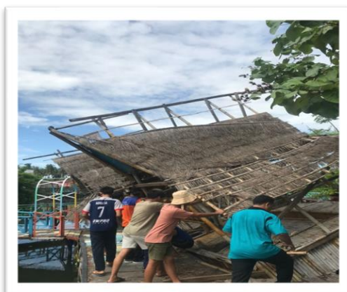
Gambar 8. Suasana Gotong Royong Bersama Warga

Tradisi gotong-royong dalam kehidupan masyarakat Indonesia sebagai warisan masa lalu ( traditional heritage ) yang diwariskan secara turun-temurun merupakan kearifan lokal yang harus dikembangkan lebih lanjut dalam kehidupan generasi saat ini. Nilai gotong royong dapat dimanfaatkan secara positif dalam kehidupan untuk menggalang solidaritas sosial agar bangsa Indonesia mampu menghadapi perubahan zaman, globalisasi dan berbagai permasalahan yang mengancam kehidupan masyarakat, seperti bencana alam, sosial dan politik (Subagyo 2012). Berawal dari permasalahan di wisata, terutama masalah sampah yang banyak di area wisata, KKN Tematik Universitas Mataram memiliki kepedulian dan kesadaran akan hal tersebut. Salah satu manfaat dari gotong royong yang dilakukan adalah dapat menyatukan warga yang tinggal di lingkungan masyarakat yang sama, dan dapat mempermudah untuk mencapai tujuan bersama.