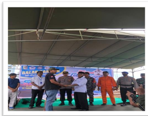
Gambar 7. Suasana Kegiatan Balap Sampan

Balap Sampan merupakan salah satu event tahunan organisasi IKBP. Kegiatan ini bertujuan untuk mempersatukan ikatan keluarga para nelayan, dan juga membantu mempromosikan wisata di kancah nasional maupun internasional. Tujuan lain dari kegiatan balap sampan, yaitu bisa melihat bakat-bakat para nelayan. Kegiatan balap sampan ini diikuti oleh sekitar 16 peserta dari berbagai desa di pulau Lombok untuk merebutkan juara 1. Event ini dilaksanakan mulai tanggal 28 Desember 2022 – 1 Januari 2023. Kami selaku mahasiswa KKN berkolaborasi dengan IKBP dan KKN-T Desa Labuhan Lombok ikut serta dalam menyukseskan acara tersebut, dengan ikut turun langsung ke lapangan dimulai dari dilakukan pembersihan pantai di sekitar lokasi balap sampan, pemasangan spanduk lomba, registrasi peserta dan tamu undangan, persiapan pemasangan tenda untuk acara