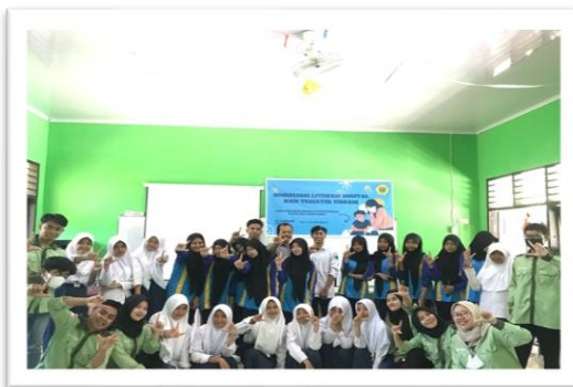
Gambar 5. Foto Bersama Siswa-Siswi Desa Seruni Mumbul

Kegiatan sosialisasi dengan tema Peran Digitalisasi dalam Mengembangkan Potensi Wisata Desa Seruni Mumbul. Sosialisasi ini bertujuan untuk meningkatkan kemampuan siswa dalam memahami tentang dunia teknologi dalam rangka mempromosikan potensi Desa Seruni Mumbul. Kegiatan ini dilaksanakan pada Selasa 10 Januari 2023. Siswa milenial berperan penting dalam memanfaatkan penggunaan digital untuk mengembangkan serta meningkatkan potensi desa wisata Seruni Mumbul hingga ke manca negara kegiatan ini dapat memberikan gambaran kepada siswa-siswi terkait penggunaan digital secara positif, yang nanti kedepannya dapat dimanfaatkan bagi siswa - siswi yang ingin terjun ke ranah media. Seperti penulis, wartawan editor, dll. Desa Seruni Mumbul adalah salah satu Desa wisata yang berada di Kecamatan Pringgabaya Lombok Timur, NTB. Desa Seruni Mumbul memiliki potensi wisata yang harus dikembangkan dan dilestarikan karena Desa Seruni Mumbul masuk ke dalam 24 besar Nasional yang diakui sebagai Desa wisata terbaik.