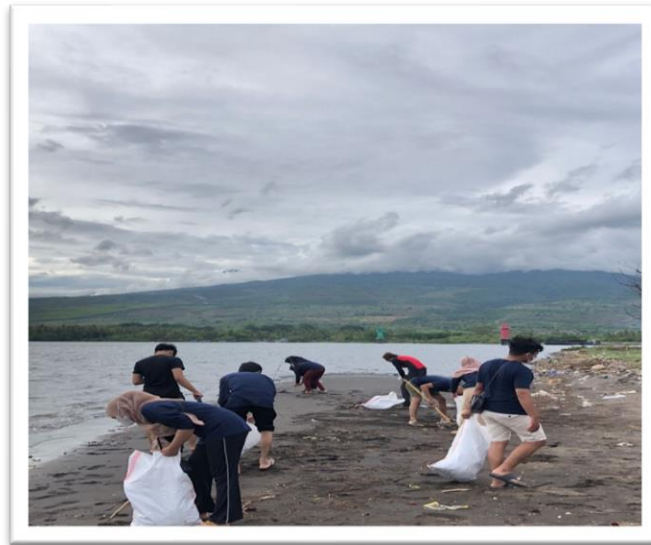
Gambar 9. Suasana Kegiatan Beach Clean-up