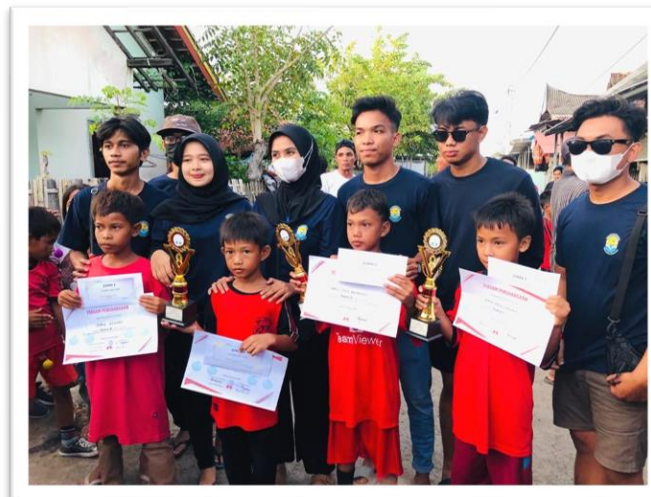
Gambar 10. Foto Bersama Juara Lomba Lato-Lato

Permainan tradisional lato-lato saat ini sedang menjadi tren di kalangan anak-anak, salah satu di antaranya terjadi di Desa Seruni Mumbul khususnya di dusun Mandar. Kegiatan ini dilaksanakan pada tanggal 10 Januari 2023, puluhan anak-anak sangat antusias mengikuti perlombaan lato-lato ini yang di selenggarakan oleh pemerintah desa setempat dan berkontribusi langsung dengan masyarakat, karang taruna dan teman-teman KKN. Meski permainan ini terlihat mudah namun nyatanya tidak semudah itu, dan juga permainan ini mempunyai dampak positif untuk mengurangi kecanduan terhadap dunia game yang sering dialami anak-anak. Perlombaan ini dimulai dengan babak penyisihan hingga terpilih 10