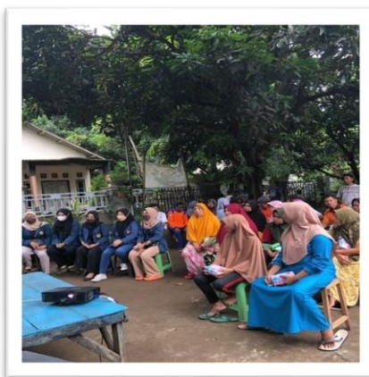
Gambar 3. Suasana Penyuluhan Pertanian