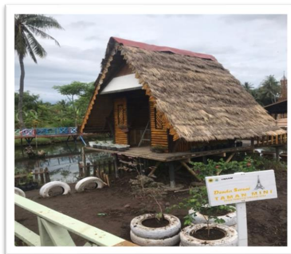
Gambar 1. Destinasi Desa Wisata Denda Seruni