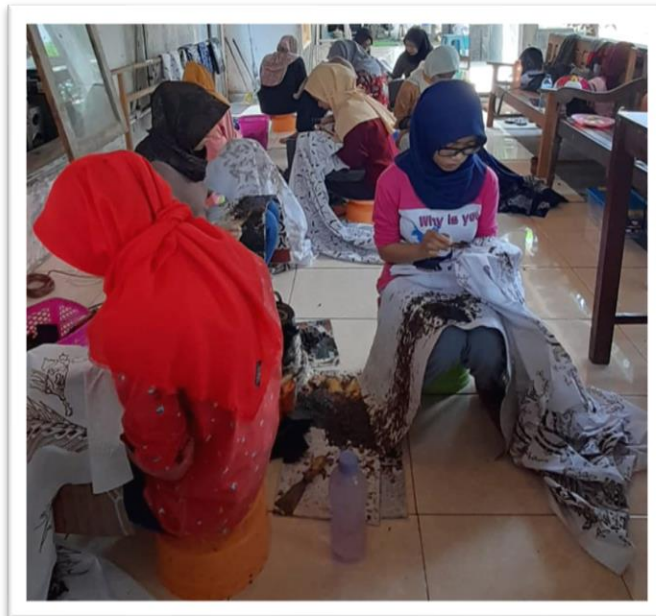
Gambar 2 Proses Chanting

Pada gambar di atas maka dapat dianalisis bahwa terdapat lima tahapan proses produksi. Hasil diskusi digunakan untuk mengetahui apakah dalam proses produksi masih terjadi kekurangan kapasitas. Ditemukan bahwa proses batik (chanting) yang masih dilakukan oleh tenaga manusia masih mengalami kendala. Kendala tersebut dikarenakan susah nya mencari tenaga kerja yang memiliki keahlian dalam membatik. Oleh karenanya, produk batik tulis kini biayanya cukup mahal. Adapaun pemecahan masalah dari kondisi ini yaitu memberikan saran kepada UMKM untuk menjadikan produk batik tulis menjadi produk premium agar dapat menutupi biaya produksi dan mampu bersaing di pasar.