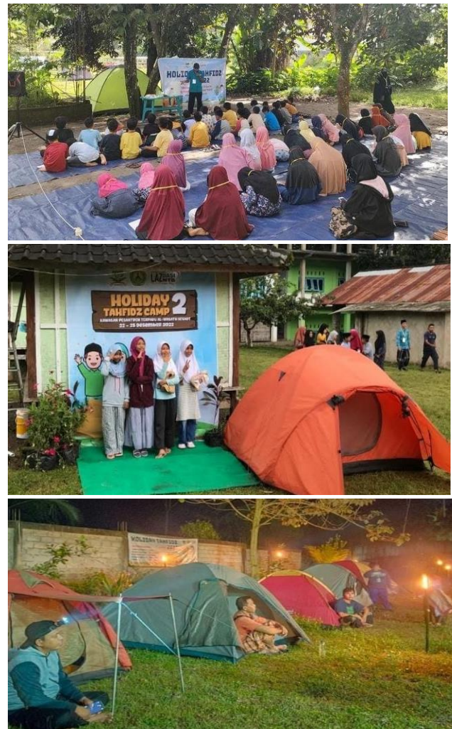
Gambar 5. Beberapa Foto Pengunjung di Area Camping Ground

Setelah melalui evaluasi, secara rutin SMK Al-Wasath mendapatkan kunjungan dari berbagai sekolah yang berasal dari Kota Mataram, Kabupaten Lombok Barat dan daerah lainnya. Implementasi circular economy melalui sampah plastik menjadi eco-brick juga tetap berjalan. Hal yang belum terlaksana adalah usaha berbadan hukum belum teralisasi. Hal ini dikarenakan masih ada perbedaan pandangan antara pihak sekolah dan Yayasan terkait posisi badan usaha tersebut, apakah berada di bawah sekolah atau menjadi bagian dari Yayasan.