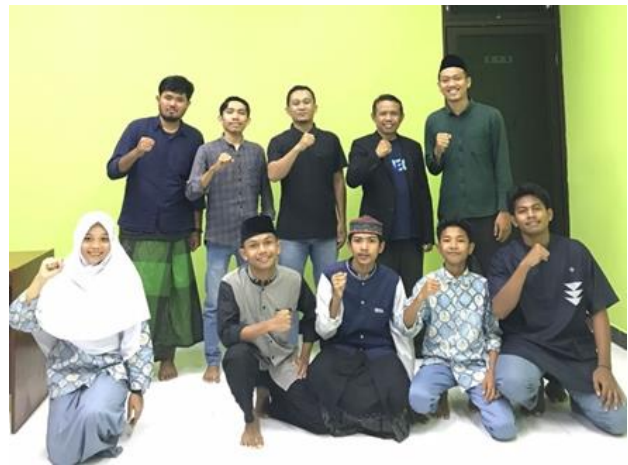
Gambar 4. Dokumentasi Pasca FGD

Proses FGD berlangsung sekitar 2 jam dengan beberapa hasil, antara lain: