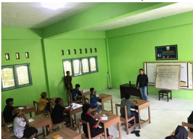
Gambar 3. Dokumentasi Penyuluhan

Pada kesempatan yang berbeda, kami juga melakukan Focus Group Discussion (FGD) dengan perwakilan Yayasan, Kepala Sekolah beserta seluruh jajaran serta perwakilan siswa. Kami menjelaskan tentang beberapa hal, antara lain: