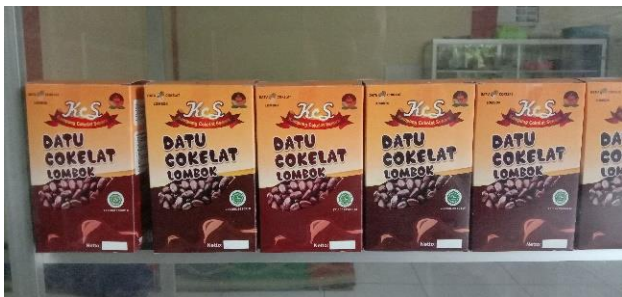
Gambar 4. Produk Olahan Komoditas Kakao

Berdasarkan hasil observasi, komoditas kakao menjadi salah satu komoditi yang produktif di Desa Genggelang. Berdasarkan data profil Desa Genggelang, produktivitas komoditas Kakao mencapai 636,41 Kg/Ha dengan luas tanam 554,72 Ha. Selain kakao, komoditas lain yang memiliki potensi besar untuk dikembangkan adalah kopi. Produktivitas komoditi kopi mencapai 653,06 Kg/Ha dengan luas tanam 314,89 Ha. Dengan demikian, Desa Genggelang sudah