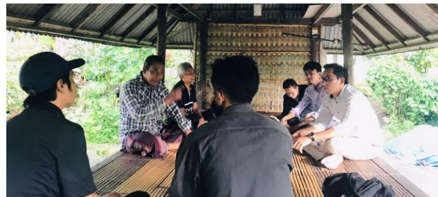
Gambar 2. Diskusi dengan Warga Desa Geggelang