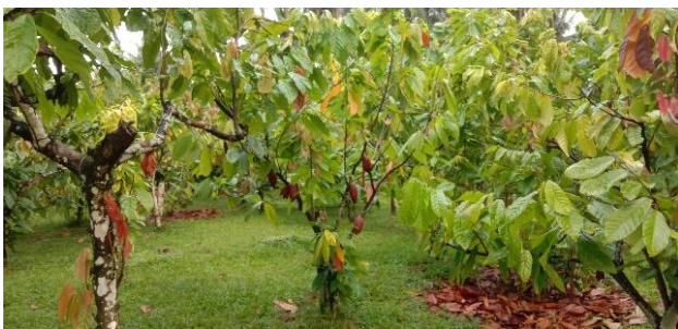
Gambar 3. Potensi Agrowisata Komoditas Kakao