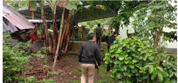
Gambar 5. Kunjungan ke Pabrik Kopi

memiliki modal awal dalam pengembangan agrowisata.