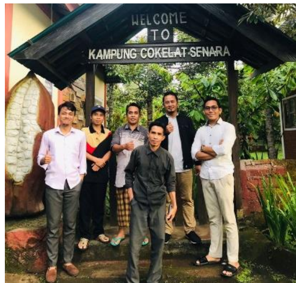
Gambar 6. Kunjungan ke Pabrik Coklat (Kampung Senara)