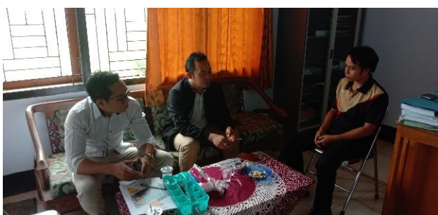
Gambar 1. Diskusi dengan Kepala Desa

Diskusi dengan Kepala Desa, Sekretaris Desa, maupun perangkat Desa bertujuan untuk membantu mengidentifikasi dan menilai potensi-potensi yang ada di Desa Geggelang. Hal ini dapat mencakup potensi sumber daya alam, budaya lokal, potensi ekonomi dan lain sebagainya. Diskusi dilakukan sebagai penajakan awal kegiatan pengabdian sehingga bertujuan untuk merencanakan pengembangan desa berdasarkan potensi yang telah teridentifikasi. Melalui diskusi yang terbuka dan kolaboratif dengan Kepala Desa, maka hal tersebut dapat membantu dalam menyusun program pembangunan Desa yang lebih terarah dan sesuai dengan kebutuhan masyarakat Desa Geggelang.