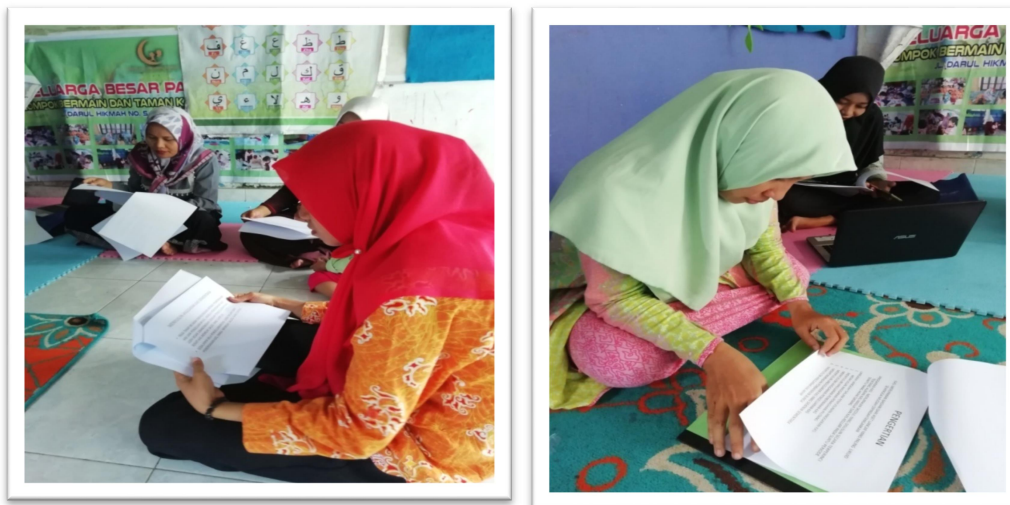
Gambar: Penyuluhan Anggaran Kas oleh Tim Pengabdian

Berdasarkan jenis-jenis penerimaan dan pengeluaran tersebut pihak manajemen KB/TK Purnama berkomitmen untuk menyusun anggaran tahun 2020. Penyusunan anggaran bisa diperinci untuk setiap triwulan, sehingga lebih mudah untuk melakukan evaluasi terhadap kinerja secara bulanan berdasarkan anggaran yang telah disusun.