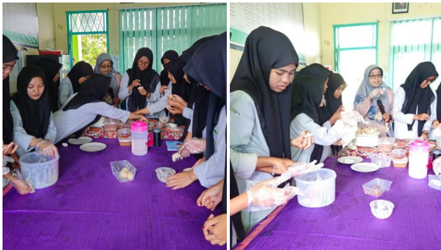
Gambar 2 : Kegiatan Pelatihan dan Praktik Pembuatan Produk Olahan Ayam

Secara keseluruhan, kegiatan pengabdian ini menunjukkan bahwa pelatihan diversifikasi produk olahan ayam melalui pembuatan siomay ayam dan pangsit ayam merupakan strategi yang efektif dalam meningkatkan kompetensi kewirausahaan siswa madrasah.