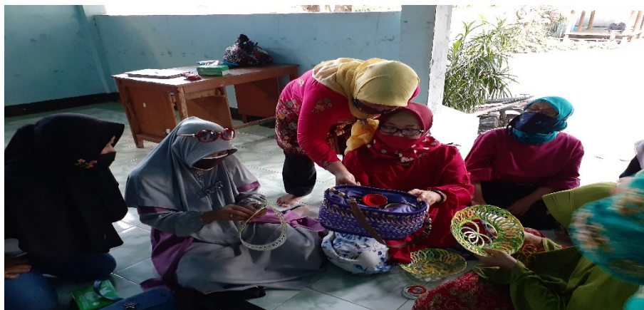
Foto: Saat Pelatihan pembuatan kerajinan berlangsung