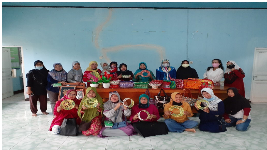
Foto: Para peserta pelatihan dan hasil karyanya

Berdasarkan pelaksanaan kegiatan pengabdian ini, dapat diidentifikasi hal-hal sebagai berikut :