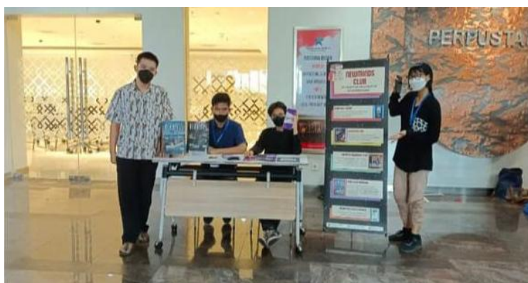
Gambar 1: Contoh event di Perpustakaan Nasional RI

Sejauh ini, Berdasarkan hasil penelitian, dalam memrakarsai kegiatan kepariwisataan, Perpustakaan telah menjalin kerja sama dengan Kementerian Pariwisata dan Ekonomi Kreatif, MRT, Transjakarta, serta subsektor pariwisata lainnya seperti hotel. Kerja sama tersebut memudahkan Perpustakaan Nasional dalam menyelenggarakan event dan pameran. Kerja sama dalam penyelenggaraan event berfungsi untuk memperkuat perencanaan, pelaksanaan, dan keberhasilan kegiatan. Melalui kolaborasi dengan berbagai pihak, pengelola dapat memperoleh dukungan sumber daya, seperti pendanaan, fasilitas, dan jaringan promosi. Selain itu, kerja sama juga membantu memperluas jangkauan peserta dan pengunjung, sehingga event menjadi lebih dikenal dan diminati. Dengan demikian, kerja sama tidak hanya mempermudah pelaksanaan kegiatan, tetapi juga meningkatkan kualitas dan daya tarik event yang diselenggarakan.