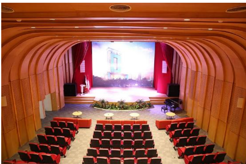
Gambar 3: Gedung Teater Perpusnas sebagai Tempat Diadakan Seminar/ Workshop

Selain event-event seperti pameran, workshop, dan seminar. Pihak pengelola Perpustakaan Nasional telah melaksanakan kegiatan lain yang juga menjadi daya tarik. Salah satunya adalah pemutaran film bagi pengunjung. Pemutaran film tentunya dapat menjadi menarik mengingat Indonesia merupakan salah satu negara yang filmnya tidak jarang masuk ke dalam nominasi Oscar. Beberapa film seperti Ngeri-Ngeri Sedap (2022) dan Yuni (2021) merupakan contoh film yang masuk sebagai nominasi dan turut ditampilkan di pemutaran film Perpustakaan Nasional. Untuk menikmati film, pengunjung dapat berkunjung ke lantai 8 dan syarat adalah registrasi dan memiliki kartu anggota.