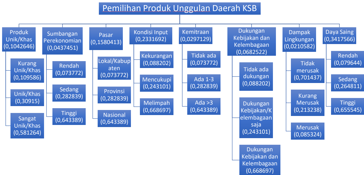
Gambar 1. Model Hirarki Analisis