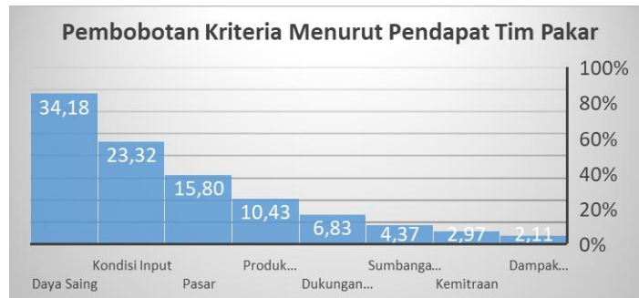
Gambar 2. Urutan Bobot Kriteria

Model hirarki ini akan dilakukan perhitungan bobot dua tingkat yaitu pembobotan terhadap 8 kriteria dan pembobotan alternatif terhadap 10 produk untuk tiap kriteria. Berdasarkan hasil perhitungan bobot kepentingan masing-masing kriteria, didapatkan urutan kriteria yang mempengaruhi pemilihan produk unggulan menurut pendapat seluruh tim pakar seperti terdapat pada gambar 2.