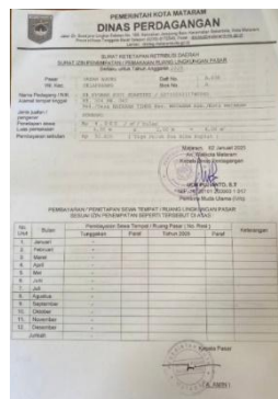
Gambar 2. Dokumen SKRD

Setiap tahapan pada flowchart penerimaan retribusi pasar didukung oleh berkas administratif yang menjadi bukti akuntabilitas dan pertanggungjawaban keuangan. Berkas pertama adalah SKRD (Surat Ketetapan Retribusi Daerah) yang berfungsi sebagai dasar penetapan kewajiban pembayaran retribusi bagi pedagang, dan menjadi acuan jumlah pungutan yang harus disetor.