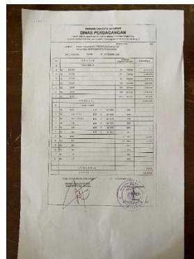
Gambar 5. Rekap Penerimaan

Kemudian, Rekap Penerimaan dibuat untuk menggabungkan seluruh penerimaan harian dalam periode tertentu sebelum dilakukan penyetoran ke bank, sehingga bendahara dapat memastikan tidak ada nominal yang terlewat.