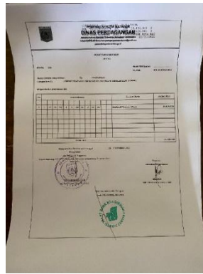
Gambar 6. Formulir STS

Berdasarkan uraian proses penerimaan retribusi pasar tersebut, penulis kemudian melakukan analisis untuk membandingkan praktik di lapangan dengan ketentuan SOP. Secara umum mekanisme pemungutan telah sesuai standar, dibuktikan dengan pelaksanaan tahapan mulai dari pendataan pedagang, penarikan oleh juru pungut, verifikasi kasir, hingga penyusunan LHPB dan STS sebagai dokumen pertanggungjawaban. Pembagian tugas antar petugas juga menunjukkan penerapan pengendalian internal. Namun, terdapat beberapa penyesuaian teknis seperti penyimpanan sementara uang di brankas untuk dihitung kembali pada keesokan hari serta mekanisme penyetoran dengan penjemputan langsung oleh Bank NTB Syariah. Meskipun tidak tertulis dalam SOP, kedua penyesuaian ini dinilai sebagai strategi operasional untuk menjaga akurasi dan keamanan penerimaan. Dengan demikian, pelaksanaan SOP di lapangan dapat dikategorikan efektif meskipun terdapat fleksibilitas pada tahap tertentu.