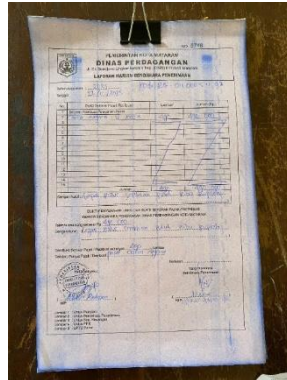
Gambar 4. LHBP (Laporan Harian Bendaha Penerima)

Setelah proses verifikasi dilakukan, kasir menyusun LHBP (Laporan Harian Bendahara Penerima) yang memuat total penerimaan pada hari tersebut untuk disampaikan kepada bendahara penerimaan sebagai dasar penyusunan STS