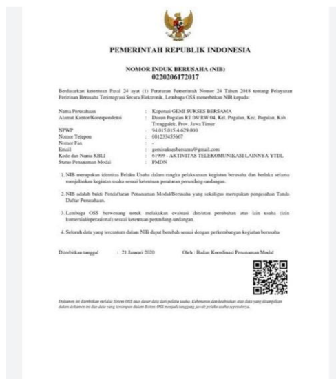
Gambar 4: Dokumen pelengkap NIB dan KBLI