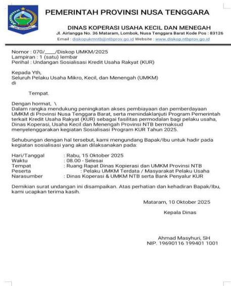
Gambar 2: Undangan Sosialisasi