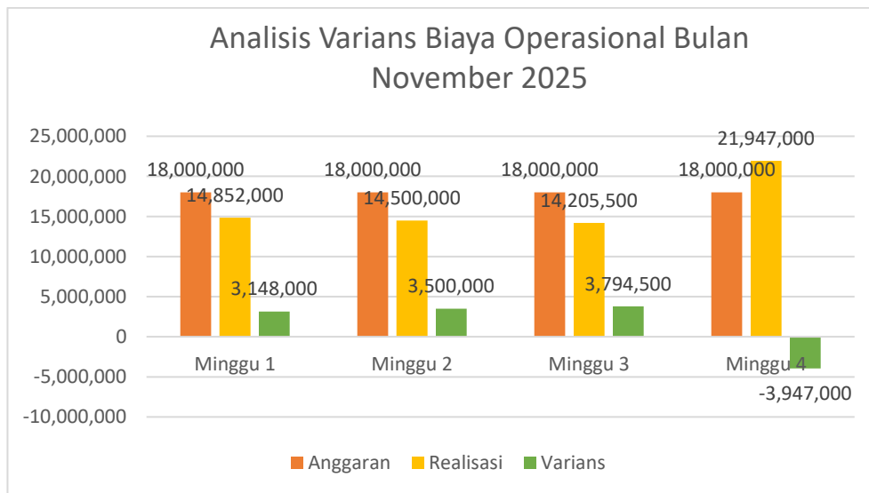
Gambar 5. Varians Biaya Operasional Bulan November 2025

Berdasarkan hasil analisis penulis selama melaksanakan magang pada PT.X Cabang NTB dan sudah melakukan wawancara bersama personel administrator yang mengelola dana Petty Cash . Dapat di lihat dari diagram varians di atas bahwa tiga minggu pertama pada bulan September, Oktober dan November realisasi pengeluaran konsisten berada di bawah anggaran sehingga menghasilkan varians yang baik/sesuai. Dalam artian anggaran yang di tetapkan setiap minggu yaitu senilai Rp. 18.000.000 sudah mampu menangani setiap kebutuhan operasional pada PT.X Cabang NTB. Sehingga tidak ada kekurangan dana di setiap permintaan pembelian kebutuhan kantor.