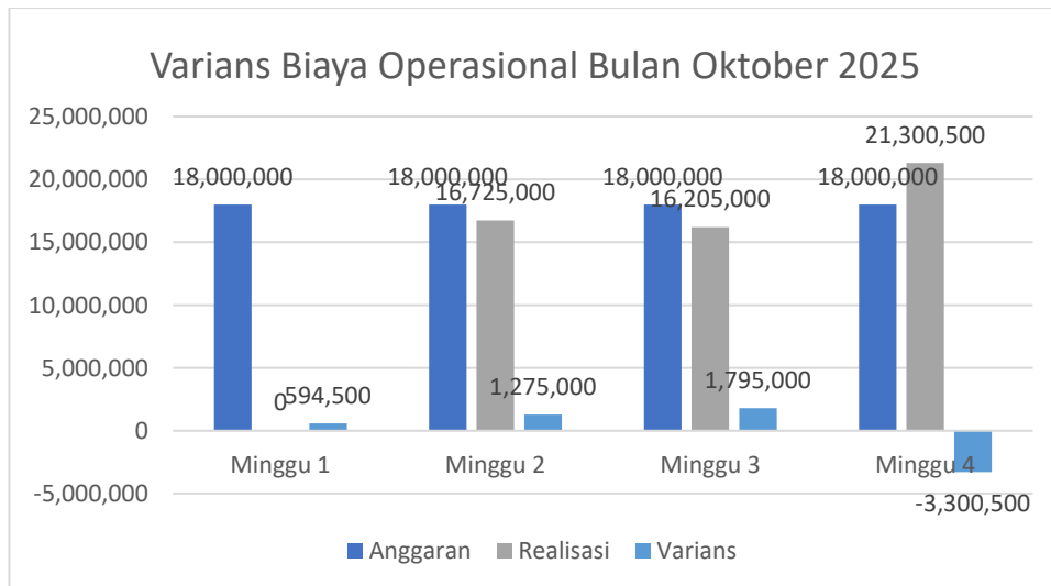
Gambar 4. Varians Biaya Operasional Bulan Oktober 2025