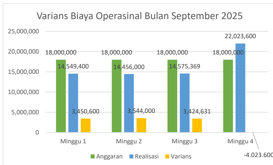
Gambar 3. Varians Biaya Operasional Bulan September 2025